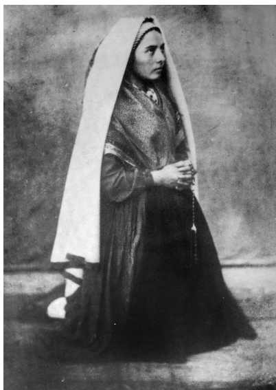
Bernadette Soubirous en train de prier